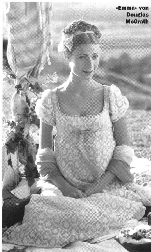
«Emma» von Douglas McGrath

Das alles spielt sich jedoch in einem Klima festgefügtter Ordnung und vor dem Hintergrund einer nie in Frage gestellten Ethik ab. Jane Austens Heldinnen und Helden sind Menschen mit Fehlern und Schwächen. Wären es es nicht, niemand würde sich in ihnen wiederfinden. Sie existieren aber und kommunizieren miteinander in einem Milieu, das gute Sitten und Ideale noch als solche anerkennt. Die äusserlichen Eigenarten und Umgangsformen bewahren sie vor der Vulgarität, und auch wer Unrecht tut, weiss noch um die öffentliche Missbilligung seines Verhaltens. Wer in Jane Austens Welt seinem Gegenüber mit ausgesuchter Höflichkeit einen Stich ins Herz versetzt, tut das für die Leserin und den Leser – und für das Filmpublikum – im klaren Bewusstsein der Tatsache, dass er damit gegen den Konsens seiner Umwelt verstösst. Bei aller Wurmstichigkeit und Unvollkommenheit ist diese Welt nicht nur in ihrer äusseren Erscheinung, sondern auch in ihrem inneren Gefüge das deutliche Gegenteil der amerikanischen Gesellschaft. Man muss gar nicht so weit gehen wie