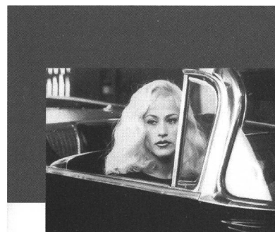
Georg Seesslen David Lynch und seine Filme

In der Tat bewegt sich Lynchs gebrochener männlicher Protagonist in äusserster Nähe zum Subjekt Lacans, dessen Wunsch nach dem Offenen sich auch unausweichlich in Bildern und Projektionen verheddert. Gegenüber einer psychoanalytischen Lehre – selbst einer, die sich vom Surrealismus inspirieren lässt – hat Kunst allerdings einen entscheidenden Vorteil: den der mangelnden Eindeutigkeit. Während die Lacan-Schule die Gespaltenheit des Subjekts als strukturelle Konstante, quasi als ahistorische condition humaine interpretiert, erzählt Lynch einfach Geschichten. Die vermögen wohl aktuelle Befindlichkeiten auf den Punkt zu bringen, lassen aber vollständig offen, wie weit deren Voraussetzungen historisch entstanden und dementsprechend zu überschreiten sind. Dass Lynch – rein deskriptiv – den Nerv der Zeit trifft, scheint mir allerdings ausser Zweifel. Jeder, der einmal die konfektionierten Eindeutigkeiten ablegt, mit denen wir uns dem jeweiligen sozialen Umfeld kompatibel machen, wird irgendwann im Innern auf seinen Fred und seinen Pete stossen – und auch auf deren schreiende Unvereinbarkeit. Vielleicht ist dies das Schicksal des Subjekts, das zwar bis zum Ende aufgeklärt, aber immer noch männlich ist. ■