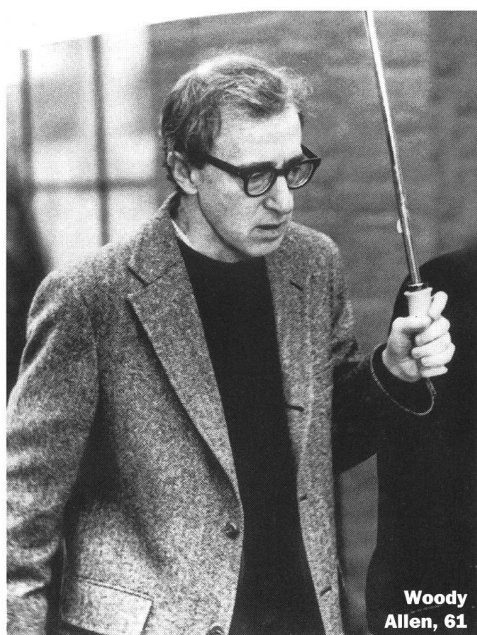
Woody Allen, 61