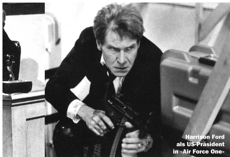
Harrison Ford als US-Präsident in «Air Force One»

Mit «Air Force One» hat Petersen beim amerikanischen Publikum einen Nerv getroffen. Sogar politische Kommentatoren fühlten sich bewegt, die Parteien im Land aufzufordern, sich an diesem Hollywood-Film ein Beispiel zu nehmen. Vielleicht, heisst es da bei einem Washington-Korrespondenten, könnten Republikaner und Demokraten von dem Triumph dieses Kino-Präsidenten ja etwas lernen: Amerikaner wollen, dass ihre gewählten Führer gemachte Versprechen halten und Prinzipien wichtiger nehmen als Politik. ■