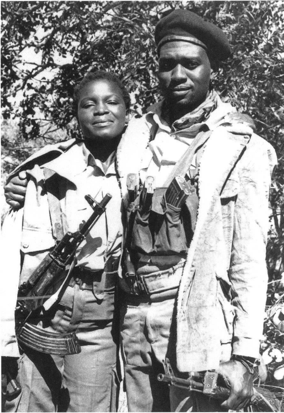
«Flame» von Ingrid Sinclair (Zimbabwe 1996)