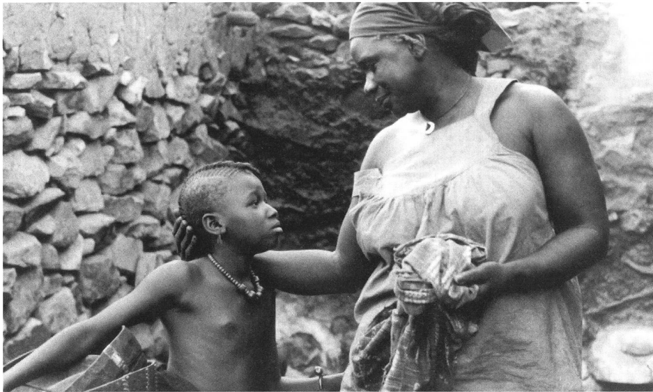
«Taafe fanga» von Adama Drabo (Mali 1997)

Staaten Westafrikas, zumindest in den grösseren Städten eine halbwegs funktionierende Kinolandschaft.