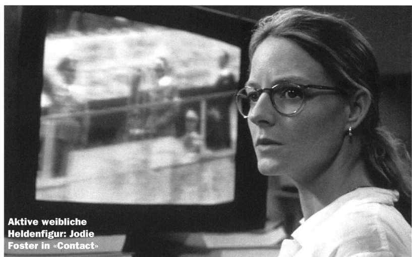
Aktive weibliche Heldenfigur: Jodie Foster in «Contact»

Zur Zeit der grossen Helden, der John Waynes und Charlton Hestons, gestattete Hollywood den Frauen nichts als einen dekorativen Gegenpart, den ruhenden Pol, die Rolle des verlässlichen, bestenfalls ein wenig koketten Wesens, zu dem die Männer nach vollbrachter Aufgabe heimkehrten. Ganze Genres wie der Western, der Kriegsfilm und der frühe Science-fiction-Film reduzierten Frauen auf das Klischee des Heimchens am Herd, der tugendhaften Freundin oder Mutter, der meist verängstigten, wenn auch hilfreichen Gefährtin. Individualität war ihnen nur jenseits der gesellschaftlichen Schranken gestattet, zum Beispiel als Prostituierte, als Verbrecherin oder als Geistesgestörte. Starke Frauen, wie sie von Joan Crawford und Bette Davis verkörpert wurden, bestätigten als Ausnahme die Regel und galten zumeist als «unweiblich».