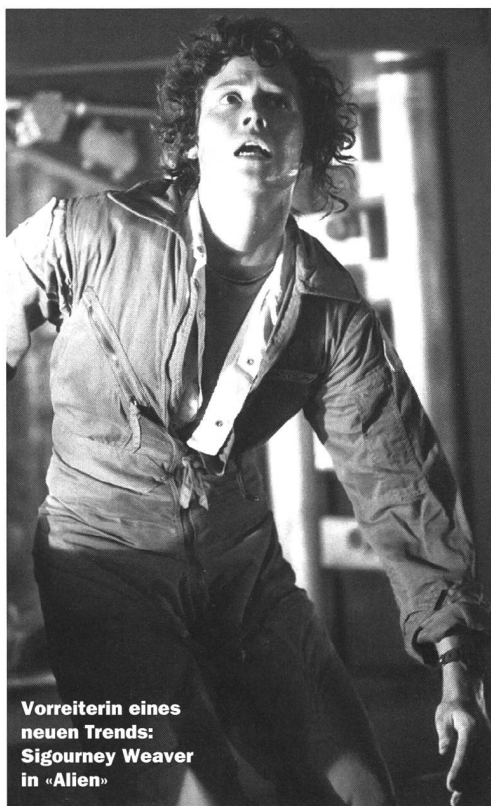
Vorreiterin eines neuen Trends: Sigourney Weaver in « Alien »

Eine Expertin ganz anderer Art ist im amerikanischen Fernsehen « Xena: Warrior Princess », eine die Kampfaxt schwingende Heroine, die es gleich mit Dutzenden von Männern aufnimmt. Die Serie hat das Auslandsgeschäft des Produzenten so überraschend angekurbelt, dass sie zur Zeit in der Branche als Paradebeispiel für die zunehmende Bedeutung ausser-amerikanischer Kunden der Hollywood-Studios zitiert wird. Wer weiss, vielleicht sind die intellektuell überlegenen Kinoheldinnen ja nur eine Übergangsstufe zur Muskelfrau als Action-Idol. Die Zukunft wird zeigen, wie ernst Hollywood es meint mit dem gewandelten Frauenbild, oder ob auch das nichts weiter ist als eine berechnende Manipulation des Publikums. ■