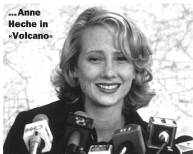
...Anne Heche in « Volcano »

Angeles lauern. « The Lost World: Jurassic Park » spricht einer Frau die Rolle der um Umwelt und das Überleben der Arten besorgten Paläontologin zu. Nicole Kidman spielt in « The Peacemaker » eine Expertin für Nuklearwaffen, Jodie Foster in « Contact » eine Astrophysikerin, Linda