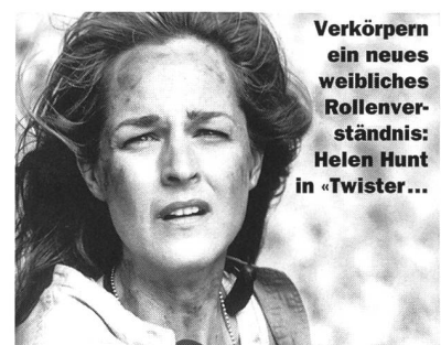
Verkörpern ein neues weibliches Rollenverständnis: Helen Hunt in «Twister...»

Helen Hunt in «Twister» (ZOOM 9/96), Anne Heche in «Volcano», Julianne Moore in «The Lost World: Jurassic Park» (ZOOM 8/97), Nicole Kidman in «The Peacemaker» und eben Jodie Foster in «Contact» sind Beispiele für ein neues Rollenverständnis, das in Hollywood um sich zu greifen scheint. Sie stehen nicht mehr länger im Hintergrund und sorgen nicht mehr für die ausschliessliche Bewunderung männlicher Heroen. Sie sind auch nicht länger gezwungen, glamouröse Modeblattfiguren zu spielen. In Jeans und Pullover, oft genug unge-