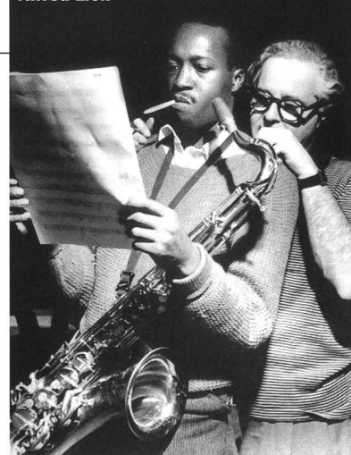
Hank Mobley Alfred Lion

Ich habe gelernt was es bedeutet, Respekt gegenüber einem Musiker aufzubauen. Als der Film fertig war, hat er mir auch Türen geöffnet zu verschiedensten Künstlern. Der Schlagzeuger Max Roach