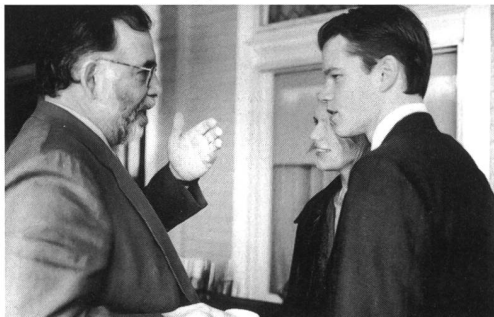
Francis Ford Coppola (mit Matt Damon und Claire Danes) bei der Verfilmung von John Grisham's «The Rainmaker»

Ein Bestseller ist ein möglicher Garant für einen erfolgreichen Film. Immer öfter setzt Hollywood auf King, Crichton, Grisham und Konsorten. Doch nicht nur in den USA erkennt man die geldvermehrnde Kraft der Bestseller. So kauf-