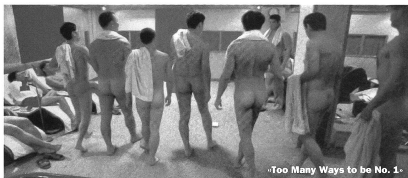
«Too Many Ways to be No. 1»