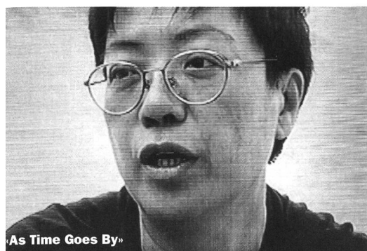
«As Time Goes By»

Neben dem «Hong Kong Panorama» und «History in the Making» war die Sektion «Hong Kong Cinema Retrospective» mit dem Titel «Transcending the Times: King Hu & Eileen Chang» ein letzter Hongkong-Schwerpunkt. Sowohl King Hu als auch Eileen Chang haben ihre wichtigsten Werke in der Boom-Zeit Hongkongs geschaffen und sind rückblickend für viele zu Ikonen der guten alten Zeit geworden. In einem von posthandover und Asienkrise durchgeschüttelten Hongkong blickt man deshalb mit besonderer Nostalgie auf diese Filme zurück. ■