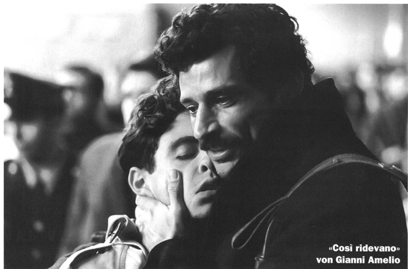
«Così ridevano» von Gianni Amelio

Erstmals seit 1988 hat mit Gianni Amelios «Così ridevano» ein italienischer Film den Goldenen Löwen erhalten. Die Geschichte zweier Brüder zwischen 1958 und 1964 spiegelt sozialkritisch die inneritalienische Süd-Nord-Migration, die schon in Luchino Viscontis «Rocco e i suoi fratelli» (1960) das Thema war. Die beiden Brüder opfern sich zu verschiedenen Zeiten füreinander, leben sich aber immer mehr auseinander, und am Schluss scheint zwischen den beiden eine unsichtbare Wand zu stehen. Streckenweise wirkt der eindrückliche Film allerdings allzu stilisiert und dadurch auch unnötig bedeutungsschwanger. Der mit dem katholischen OCIC-Preis ausgezeichnete Film «L'albero delle pere» von Francesca Archibugi stellt eine aus den Fugen geratene Römer Familie in den Mittelpunkt. Die drogensüchtige Mutter hat einen Sohn und eine Tochter von zwei Vätern. Die Eltern gehören zur 68er-Generation, deren Träume weitgehend gescheitert sind. Etwas von ihren utopischen Hoffnungen ist noch im Namen des Sohnes, Siddhartha, enthalten. Siddhartha