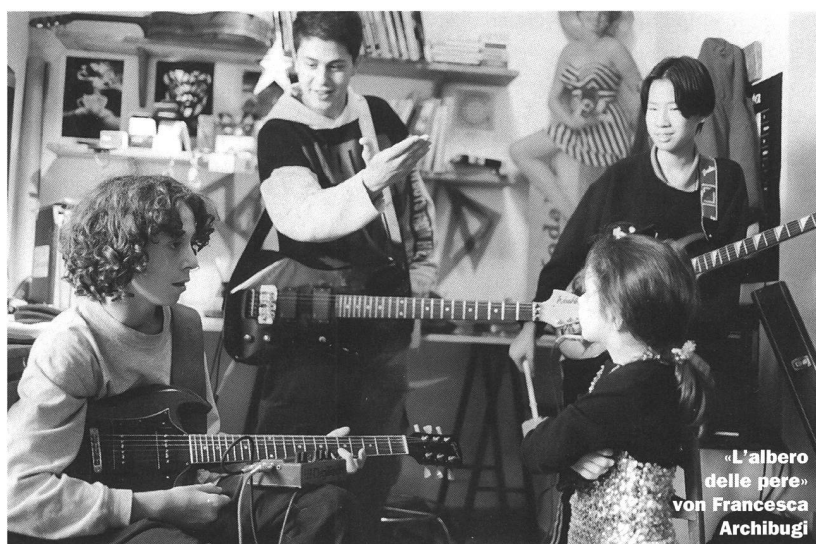
«L'albero delle pere» von Francesca Archibugi