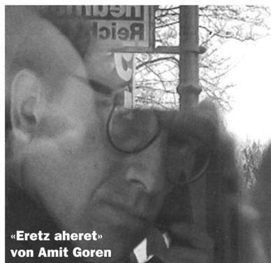
« Eretz aheret » von Amit Goren

Die Ökumenische Jury hat « Bauernkrieg » von Erich Langjahr (ZOOM 9/89) ausgezeichnet. Aus der Begründung: «Der Film zeichnet das Bild einer Landwirtschaft, die im Rahmen eines liberalisierten Welthandels Tiere vollends zur Ware macht. Durch geduldige Beobachtungen lenkt der Film den Blick auf die entwürdigende Verdinglichung der Kreatur. Er provoziert Fragen über die Grenzen der Globalisierung und über das Menschen zur Natur.»