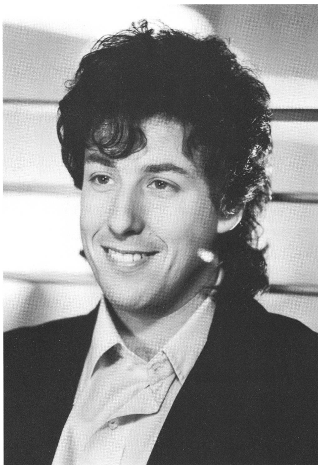
Adam Sandler: neuer Stern am Komödienhimmel

Genug der Zahlen. Was wichtiger ist, sind die Konsequenzen, die in Hollywood daraus gezogen werden. Wie stets, wenn man einer neuen Erfolgsmasche auf der Spur ist, sucht man nach der «Formel», dem Geheimrezept, nach dem die plötzlich so beliebten Filme gemacht sind. Das Gemeinsame der unerwarteten Kassenküller ist der Verzicht auf Stars sowie auf bereits arrivierte Regisseure und die Tatsache, dass sie sich an eine klar umrissene Interessentenschicht richten. Ähnlich wie im amerikanischen Fernsehen ist es zur Zeit der Markt des jugendlichen Publikums, der die durchschlagendsten Erfolge verspricht. Entgegen der Annahme, dass gerade Jugendliche nur mit technischem Grossaufwand und populären Namen zu gewinnen seien, sind die meisten Studios inzwischen davon überzeugt, dass sich das junge Publikum seine eigenen Stars macht, und dass es weniger auf dramatisches Feuerwerk als auf den richtigen Tonfall ankommt. Die Filme mit Adam Sandler sind das beste Beispiel da-