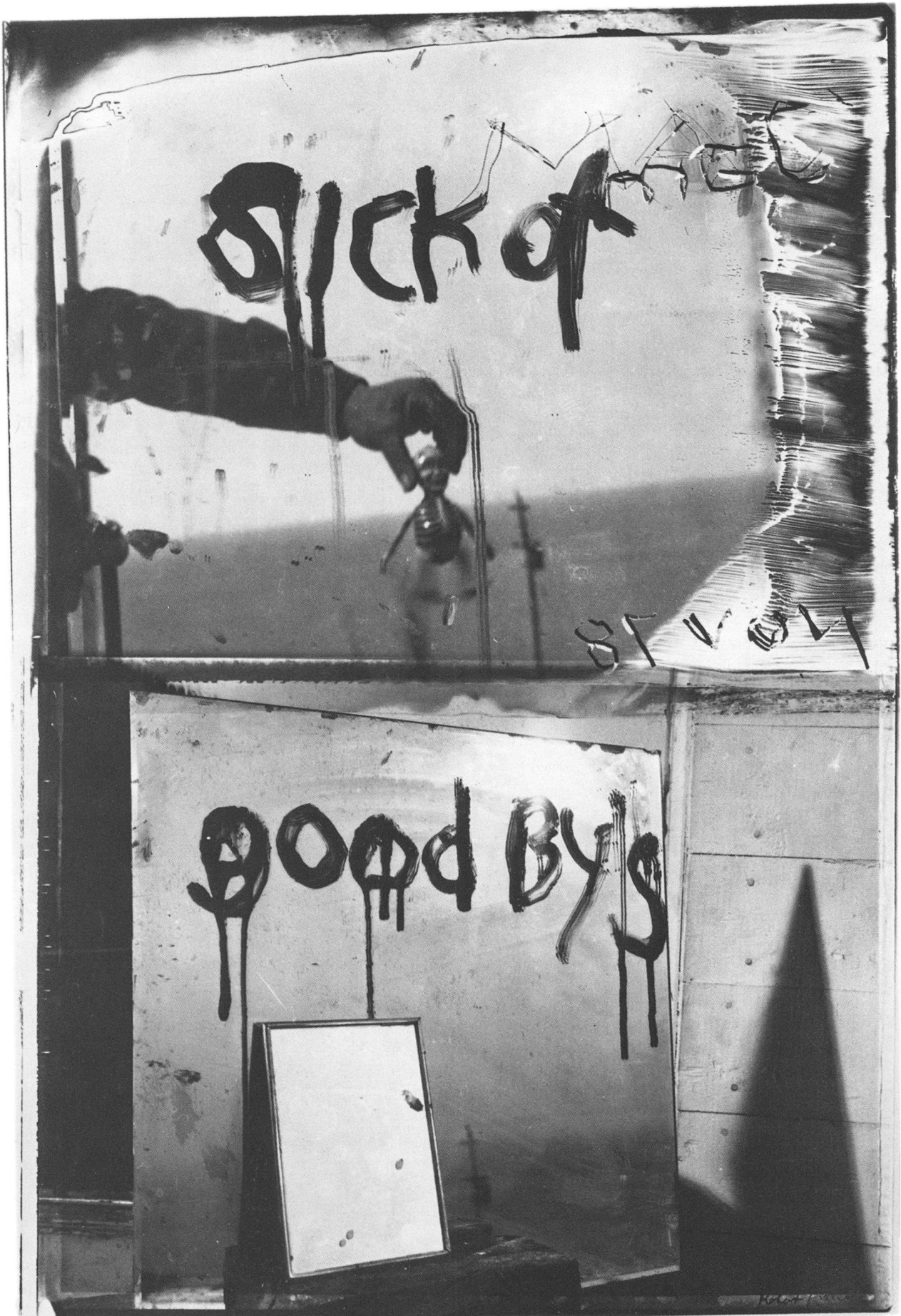
Sick of Goodby's, 1978