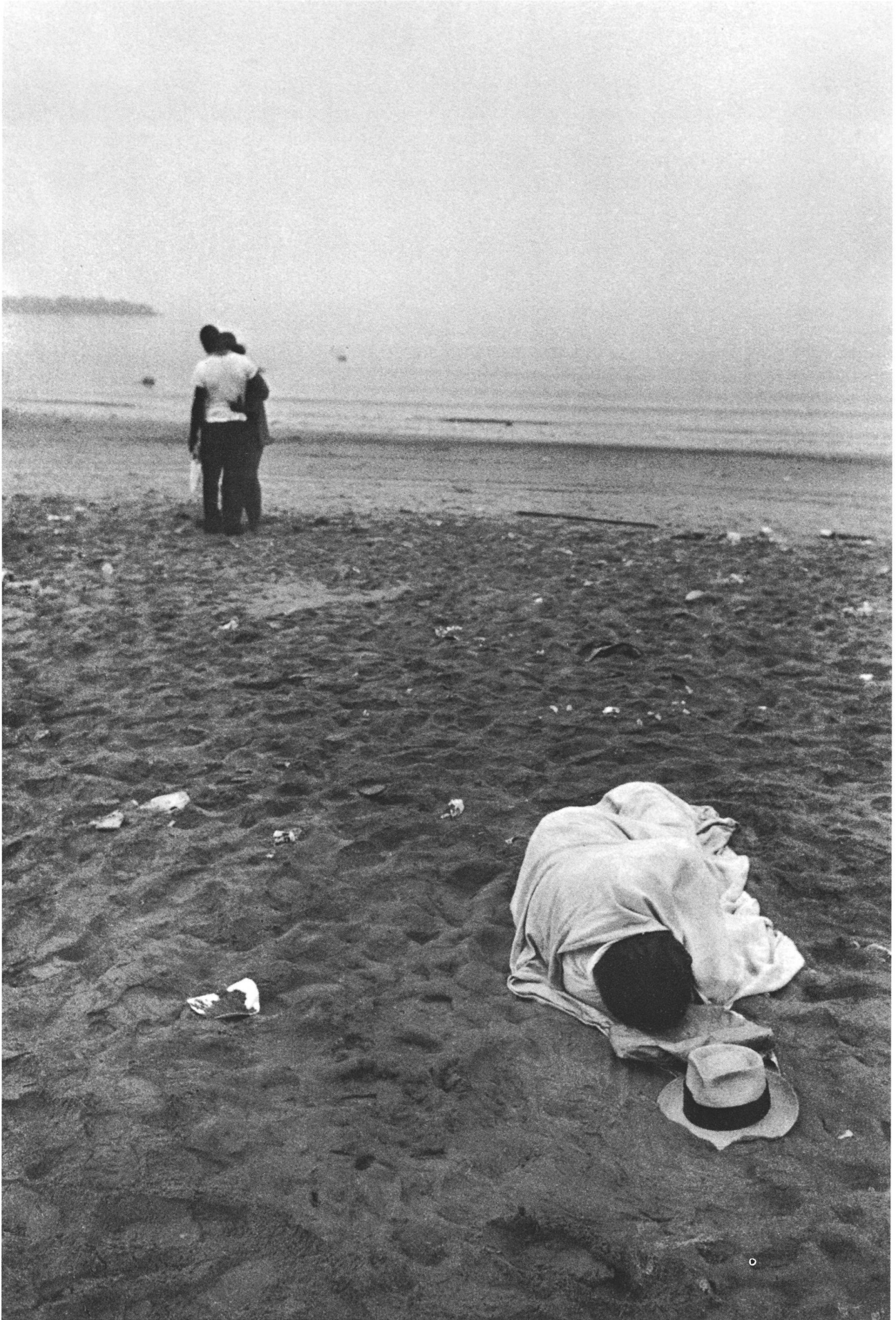
Coney Island July 4 th , 1958