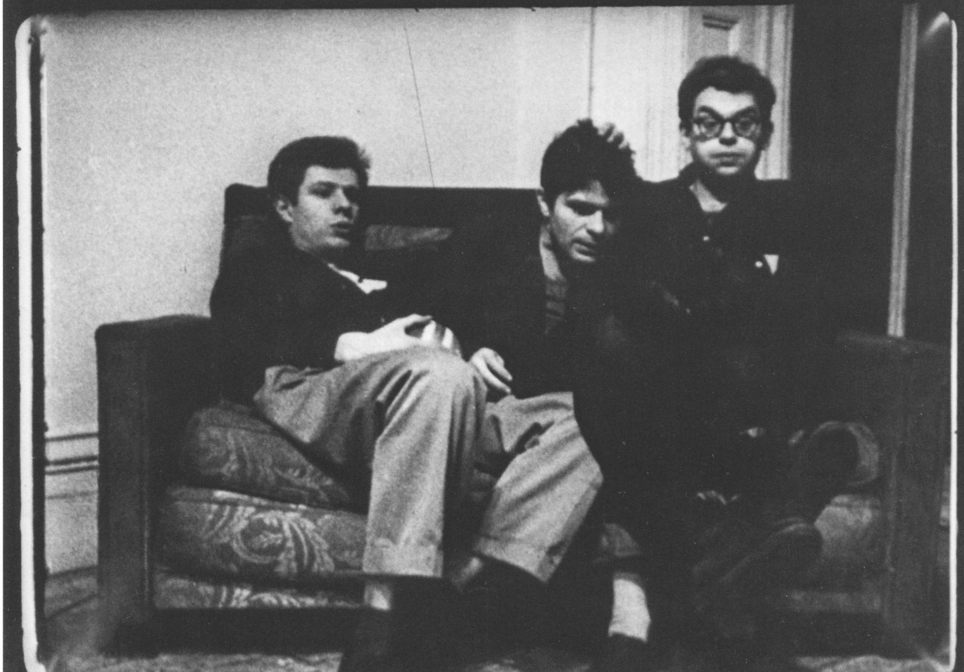
Pull My Daisy, 1959