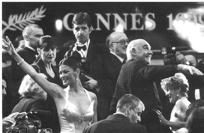
Mangels anderer Stars tagelang im Gespräch: Sean Connery und Catherine Zeta-Jones

linken, chauvinistischen Politikern wie Ex-Kulturminister Jack Lang gescholten, von den französischen Kinofans aber heissgeliebten Hollywood-Amerikaner wieder mit grossem Glamour-Geschütz auffahren? Wird es den in die Jahren gekommenen Festivalleitern gelingen, junge Filmer zu motivieren? Mal sehen. Klar ist, dass man kurz nach der Jahrtausendwende im neugestalteten Festivalzentrum am Potsdamerplatz in Berlin alles versuchen wird, um Cannes eins auszuwischen! Da muss Monsieur Jacob auf der Hut sein, will er seine zuweilen mit einer gewissen Arroganz vorgezeigte Vormachtstellung unter den Flimfestivals nicht verlieren. Das will natürlich niemand, denn bei aller Schnöderei ist sonnenklar: In Cannes munden Austern, Fische, Erdbeeren und – vor allem! – gute Filme immer noch am besten. ■