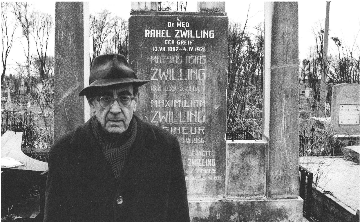
«Herr Zwilling und Frau Zuckermann» von Volker Koepp

und Geduld Tag für Tag die Klagen der Frauen über ihre Männer an. Obwohl die rechtliche Stellung der Frauen im Iran gegenüber den Männern schlecht und ungerecht ist, verbreitet der Film keineswegs Resignation oder Mutlosigkeit. Im Gegenteil, diese Frauen wehren sich mit unglaublicher Nachdrücklichkeit und Hartnäckigkeit, mit List und Finten und einer Wortgewandtheit, die des Richters Geduld bis aufs Letzte fordert. Eindrücklich auch die Solidarität der Frauen: Im Eingang zum Gerichtsgebäude halten sich immer ein paar Frauen auf und beraten die vor Gericht Geladenen in Kleidungs- und Make-up-Fragen, damit sie nicht durch ihr blosses Aussehen schon den Unwillen der gestrengen Herren auf sich ziehen. Geradezu eine Kino-Sternstunde ist die Szene, in der die kleine Tochter der Sekretärin in Abwesenheit des Richters, der zum Gebet in die Moschee gegangen ist, seinen Amtssitz besteigt und den Richter parodiert.