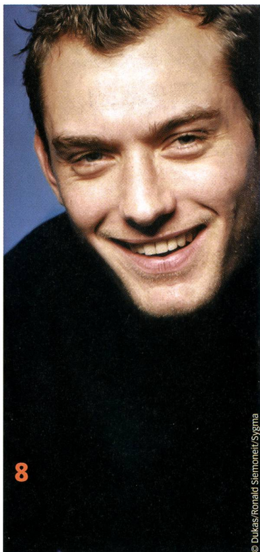
Vorläufig profiliert er sich noch in Nebenrollen: der vielversprechende Newcomer Jude Law