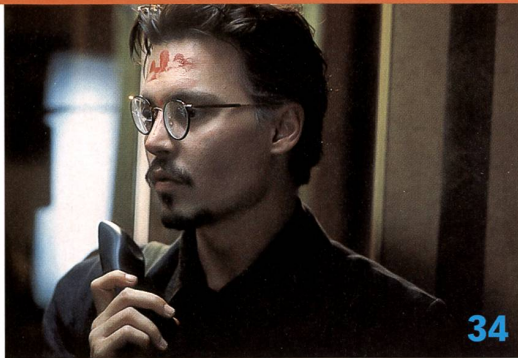
Roman Polanskis Comeback: Mit «The Ninth Gate» knüpft er an seine frühen Erfolge wie «Rosemary's Baby» an.