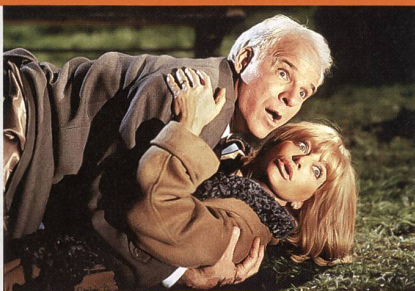
«Escapade à New York»