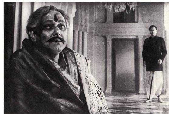
Des personnages confrontés à l'obscurantisme religieux: «La déesse» (1960).