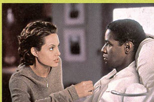
«The Bone Collector»

Avec Denzel Washington, Angelina Jolie... (1999, USA - Buena Vista). Durée 1 h 58. En salles le 26 janvier.