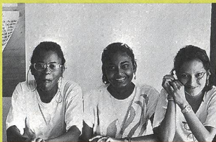
«Le bouillon d'awara»