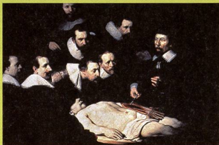
«Rembrandt Van Rijn»

«October Sky». Avec Jake Gyllenhaal, Chris Cooper... (1999, USA - UIP). Durée 1 h 47. En salles le 26 janvier.