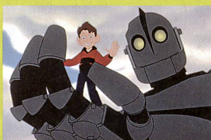
«The Iron Giant»

Avec Jean-Pierre Marielle, Anne Parillaud, Alessandra Martines, Marianne Denicourt... (1999, France - MBP). Durée 2 h 03. En salles le 5 janvier.