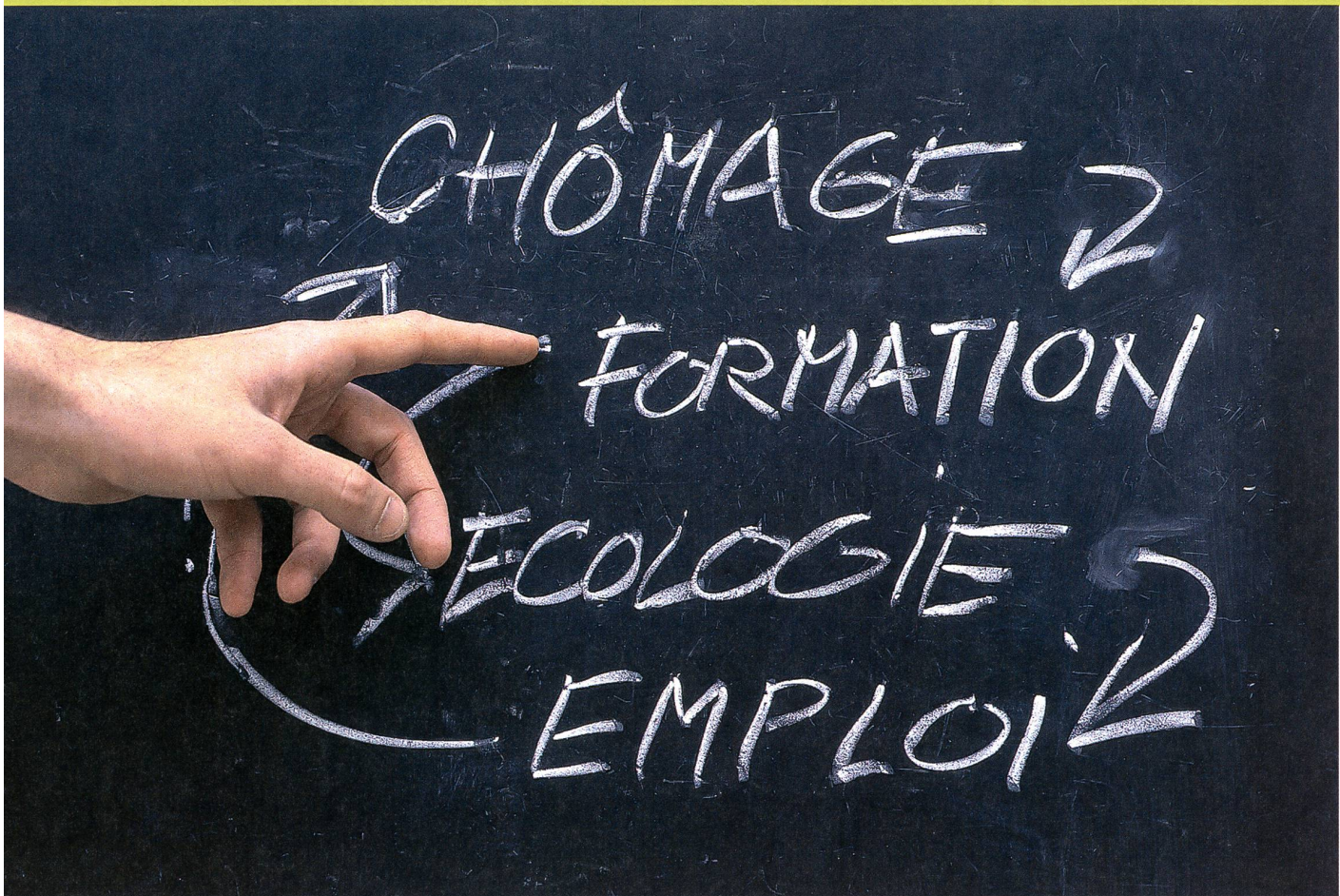
«Chronique d'une bonne intention» d'Alex Mayenfisch