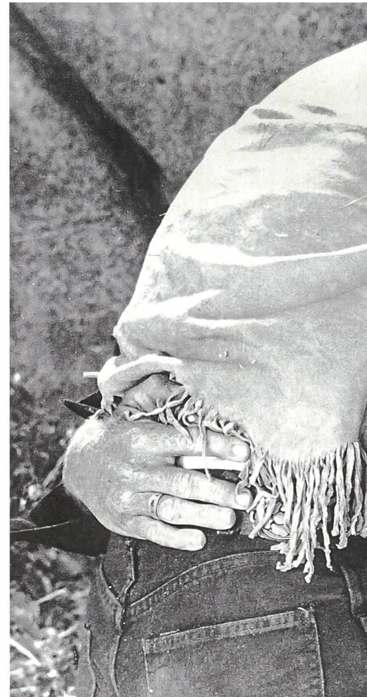
Robert Redford, shérif dans « Willie Boy » d'Abraham Polonsky

C'est également à cette période qu'il rejoint le parti communiste, comme tant d'autres intellectuels de l'époque. Engagé dans l'OSS (Office of Special Services), l'ancêtre de la CIA, il sert ensuite durant la guerre comme espion, avec pour couverture... un contrat de scénariste hollywoodien ! A la fin de la guerre, le contrat à la Paramount restant valable, Polonsky tente sa chance. Son premier scénario, la comédie d'espionnage de Mitchell Leisen « Golden Earrings » (1947) est entièrement réécrit. Mais le deuxième, réalisé par Robert Rossen pour Entreprise, un petit studio indépendant, lui vaut une nomination à l'Oscar : c'est le fameux « Sang et or » (« Body and Soul »), chronique de la