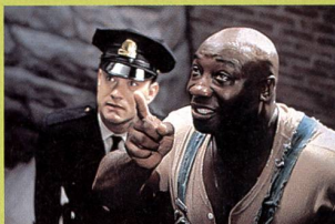
«La ligne verte»