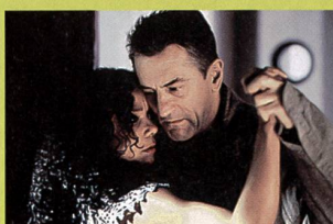
«Personne n'est parfait(e)»