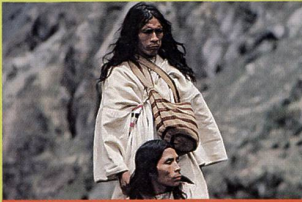
«Le chemin des neuf mondes»