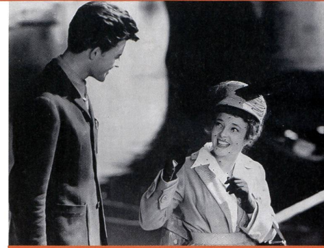
«Le diable au corps» de Claude Autant-Lara