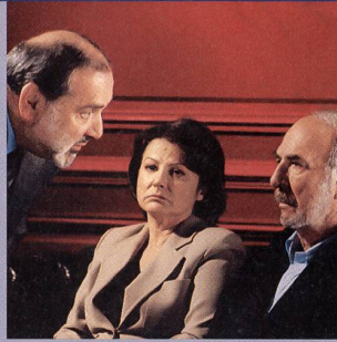
Jean Yanne, Josiane Balasko et Jean-Pierre Marielle