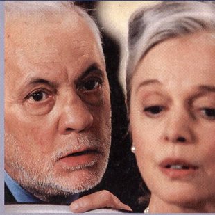
Michel Serrault et Marie-Christine Adam