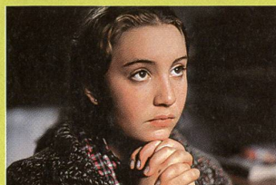
«La vie moderne»