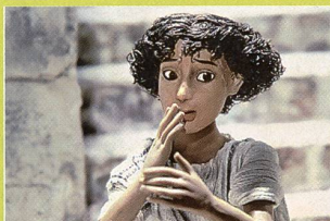
«Il était une fois Jésus»