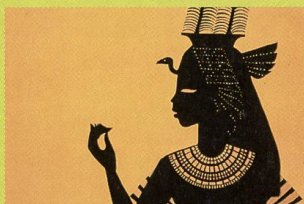
«Princes et princesses»