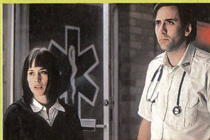
«A tombeau ouvert»