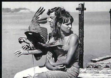
Jean-Paul Belmondo et Anna Karina

La deuxième partie du mois est consacrée au cinéma brésilien avec des films s'échelonnant des années 1940 à 1980. Des films à revoir, réalisés par Orson Welles, Hector Babenco ou encore le fameux «Terre en transe» («Terra em transe») de Glauber Rocha. Ce cycle débutera avec cinq documents.