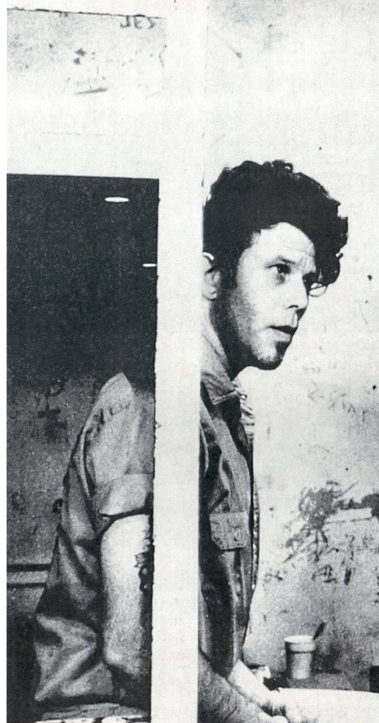
Tom Waits, John Lurie et Roberto Benigni dans «Down By Law»

Durant l'hiver 1991, Jarmusch tourne «Une nuit sur terre» («Night on Earth»), reprenant la structure éclatée