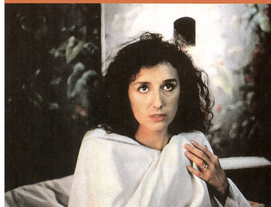
Nicoletta Braschi dans «Mystery Train»