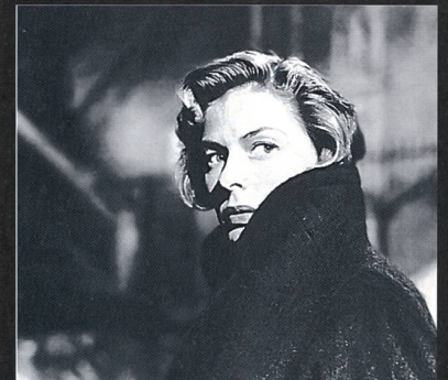
Ingrid Bergman dans «Europa 51» de Rossellini

Après la guerre, c'est-à-dire après le fascisme, l'Italie est devenue le champ de bataille du cinéma le plus moderne, l'espace libéré et républicain de toutes les explorations. Ce fut donc d'abord l'époque du néo-réalisme, des comédies corrosives «à l'italienne», puis, à partir des années soixante, d'un cinéma résolument politique comme celui de Bertolucci («La stratégie de l'araignée», «Le conformiste»), Elio Petri («Enquête sur un citoyen au-dessus de tout soupçon», «La classe ouvrière va au paradis»), Francesco Rosi («Salvatore Giuliano», «Le cas Mattei»), Pier Paolo Pasolini («Accatone», «Mamma Roma») ou plus tard les frères Taviani («Padre padrone», «La nuit de San Lorenzo»). Même des comédies comme «Amici miei» de Mario Monicelli ou «L'embouteillage» de Luigi Comencini sont ainsi marquées par la lutte politique qui s'est engagée dans le pays.