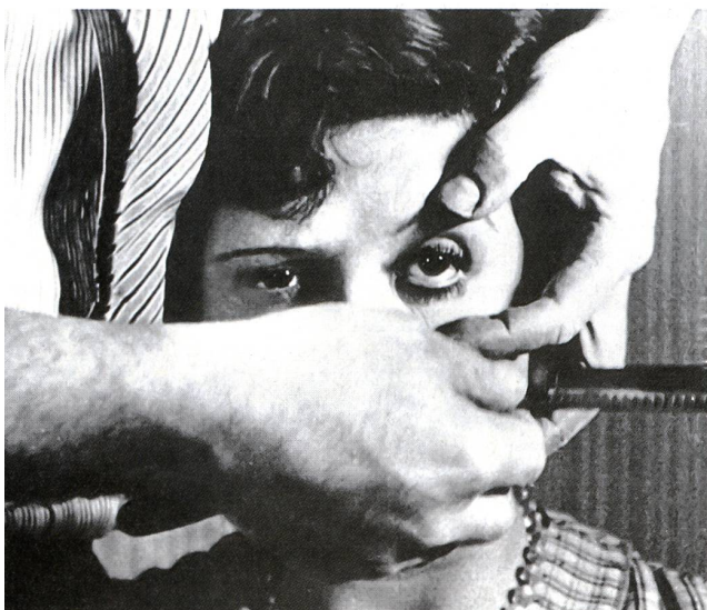
«Un chien andalou» de Luis Buñuel

Sur le tard, le cinéma d'auteur international (Altman, Resnais, Delvaux, Zanussi) s'intéresse à lui. Absent de nos écrans depuis «La famille» d'Ettore Scola («La famiglia», 1987), il nous a privé de son déclin, qui se confond avec les derniers feux de la comédie italienne. Dommage. Avec sa disparition, c'est une page du cinéma mondial qui se tourne et qu'il convient à présent de ne pas oublier. ■