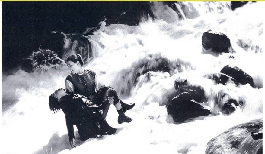
«Visages d'enfants», tourné en Suisse par Jacques Feyder