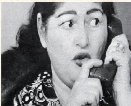
«Multiple Maniacs» de John Waters

Argos Project, Vevey. Du 23 septembre au 8 octobre. Renseignements: 021 921 50 79 et www.argos2000.ch .