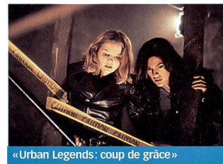
«Urban Legends: coup de grâce»