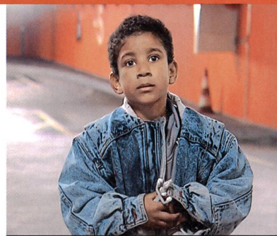
«L'arrivée» de Fernand Melgar

«La nuit du court métrage». Cinémathèque suisse, Lausanne, vendredi 20 octobre dès 20 h. Bleu Léopard, Lausanne, dimanche 8 octobre dès 20 h. Renseignements: 021 311 09 06.