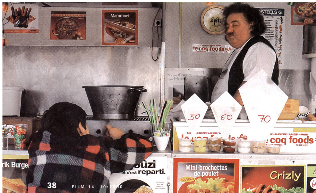
«La bouée» de Bruno Deville

CAC-Voltaire, Genève. Du 9 octobre au 29 octobre. Renseignements: 022 320 78 78.