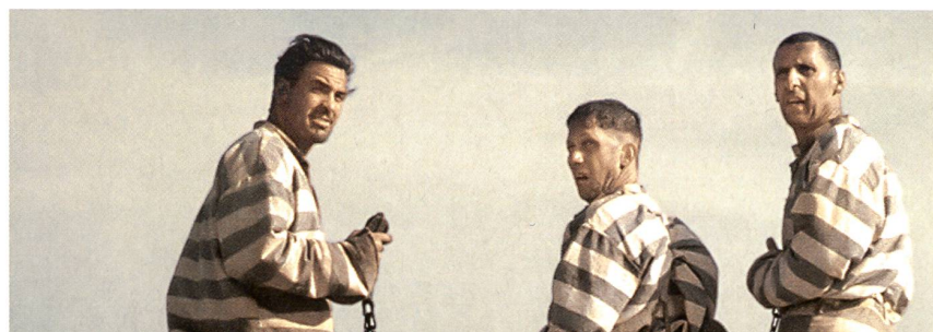
◀◀ Joel et Ethan Coen