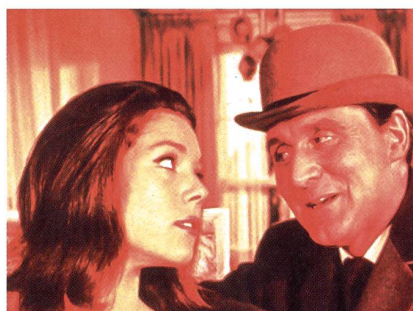
«Chapeau melon et bottes de cuir» («The Avengers»), série désormais culte

Une autre veine de créations et d'adaptations a fertilisé le genre: la saga historique, trempée d'aventures et d'intrigues. «Les rois maudits»,