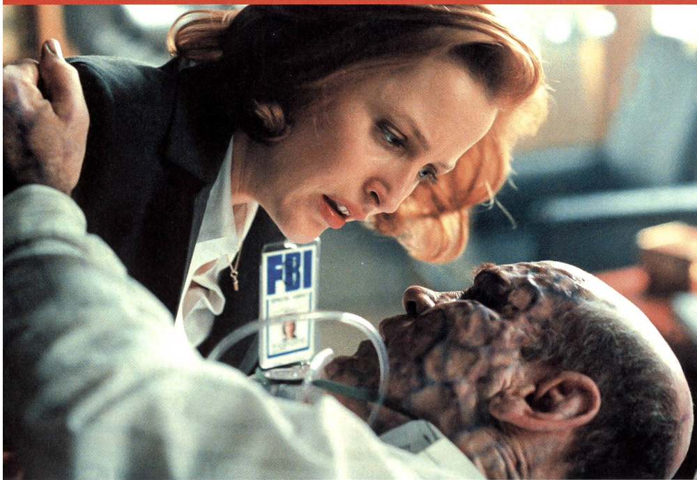
«X-files», avec Gillian Anderson dans le rôle de Scully, les jeudis à 20 h 50 sur M6

flux intarissable des inédits – produits calibrés ou créations audacieuses à l'écriture scénaristique et filmique sophistiquées.