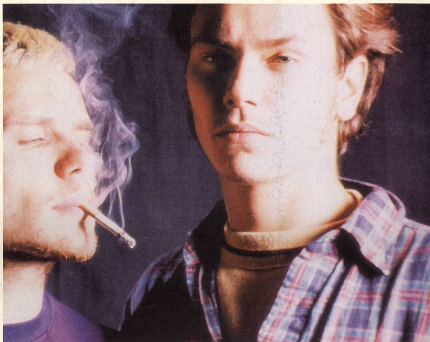
«My Own Private Idaho», road movie de Gus Van Sant