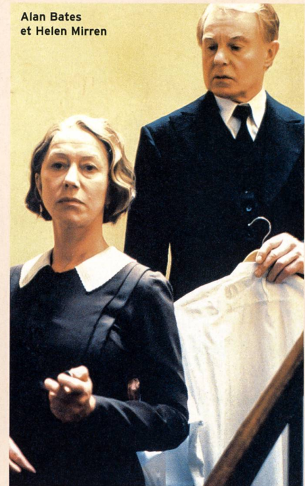
Alan Bates et Helen Mirren

Cet apparent dédain du star system trouve sans doute son origine dans les débuts de Bates. Formé à l'Académie royale d'art dramatique de Londres, il se fait