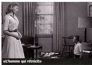
«L'homme qui rétrécit»