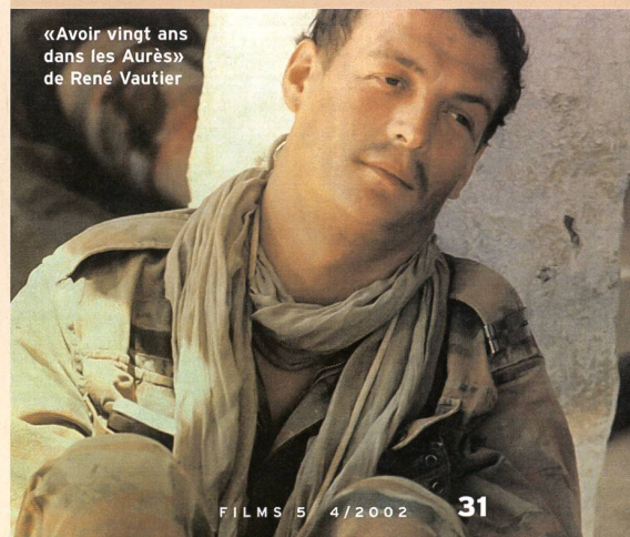
«Avoir vingt ans dans les Aurès» de René Vautier

Cycle René Vautier. Cinéma Spoutnik, Genève. Du 1 er au 7 mai. Renseignements: 022 328 09 36 ou www.spoutnik.info