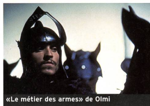
«Le métier des armes» de Olmi