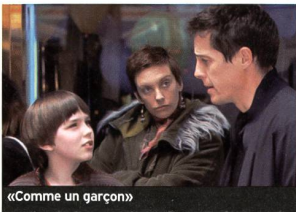
«Comme un garçon»

Alex nage en pleine crise existentielle. Sa vie de couple est terne et il n'a plus goût à rien. Un jour, le facteur lui apporte un paquet contenant une planteuseuse poupée en silicone moulée. La «bombe sexuelle» occupe d'emblée une place centrale dans le quotidien du quadragénaire. Scénario rocambolesque à la hauteur d'un Dupontel déjanté. Reste à voir le résultat! (lm) Avec Albert Dupontel, Marianne Denicourt... (2001, France JMH). Durée 1 h 32. En salles le 21 août.