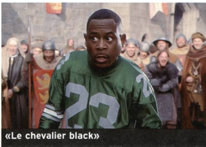
«Le chevalier black»

Will, coureur de jupons de 38 ans, s'invente un fils afin de s'infiltrer dans les réunions d'entraide aux familles monoparentales pour draguer des mères célibataires. Il y fait la connaissance de Marcus, garçon de 12 ans, et devient son ami. Adapté d'un roman de Nick Hornby («Haute fidélité») et présenté comme la version masculine du «Journal de Bridget Jones» («Bridget Jones's Diary»), «Comme un garçon» est signé par les frères Weitz, réalisateurs d'«American Pie». (cl) «About a Boy». Avec Hugh Grant, Toni Collette, Rachel Weisz... (2002, USA / France / GB - UIP). Durée 1 h 40. En salles le 28 août.