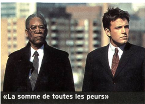
«La somme de toutes les peurs»

Le film de politique-fiction droitier est de retour avec «La somme de toutes les peurs», interminable récit mélangeant hyperterrorisme, angoisse nucléaire, résurgence d'extrêmes droites européennes et retombées sanglantes de la guerre froide qui vaut essentiellement pour sa traumatisante explosion nucléaire en plein cœur de Baltimore. L'accumulation, loin d'engendrer une dynamique paranoïaque propre aux récits américains, rend le film empesé et vieillot. La somme, ici, équivaut à zéro. (jsc) «The Sum of All Fears». Avec Ben Affleck, Morgan Freeman, James Cromwell, Alan Bates... (2002, USA - UIP). Durée 2 h 04. En salles le 14 août.