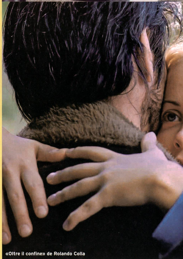
«Oltre il confine» de Rolando Colla

Chadah (révélée à Locarno avec «Bahji, une ballade à Blackpool / Bahji on the Beach»), qui raconte l'ascension d'un groupe de femme dans le monde masculin du football.