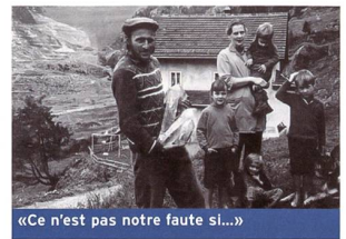
«Ce n'est pas notre faute si...»