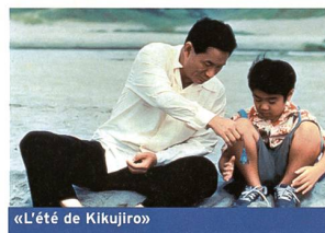
«L'été de Kikujiro»

En quelques films, Kitano Takeshi a imposé un univers singulier, fondé sur la juxtaposition habile de situations tragicomiques et de très brèves explosions de violence. Variation du «Kid» de Chaplin, «L'été de Kikujiro» s'inscrit dans la continuité de l'œuvre du cinéaste-comédien japonais; on y retrouve son personnage habituel de yakuza (gangster) placide et taciturne, la musique répétitive et sentimentale de son compositeur attiré, Hisaishi Joe, de même que son sens aigu du rythme burlesque. (lg) «Kikujiro no natsu» (1999). Avec Kitano Takeshi, Sekiguchi Yusuke, Kishimoto Kaiyoko... TSR2, le 15 août à 20 h 30.