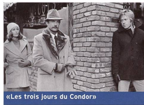
«Les trois jours du Condor»

A consommer sans modération chaque samedi sur M6 vers 17 h. Également disponible en vidéo ou DVD (Zone 2), édités par StudioCanal.