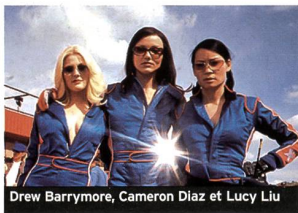
Drew Barrymore, Cameron Diaz et Lucy Liu

Chuck Russell («The Mask») s'apprête à réaliser deux nouvelles adaptations de comics. «Way of the rat», une histoire d'aventures truffée d'arts martiaux dont il pourrait écrire lui-même le scénario,