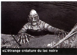
«L'étrange créature du lac noir»