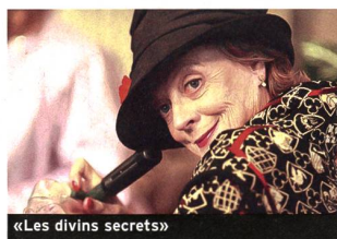
«Les divins secrets»

«Divine Secrets of the Ya-Ya Sisterhood». Avec Sandra Bullock, Ellen Burstyn, Maggie Smith... (2002, USA - Warner Bros.). Durée 1 h 56. En salles le 9 octobre.