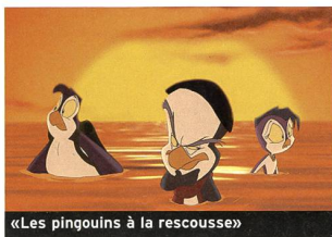
«Les pingouins à la rescousse»