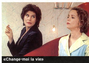
«Change-moi la vie»

Avec Zhou Xun, Chen Kun, Liu Ye... (2002, France - Filmcooperative). Durée 1 h 58. En salles le 9 octobre.