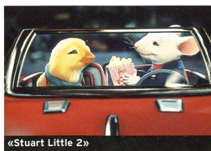
«Stuart Little 2»