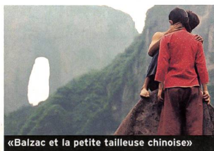
«Balzac et la petite tailleuse chinoise»

Mieux vaut limiter l'évocation d'un film aussi dépourvu d'intérêt: ce genre de pitrerie s'essaie rarement à la philosophie. Les dernières aventures d'Austin Powers font donc honneur à leur réputation en restant aussi sinistrement consternantes que les précédentes. Ceux qui s'intéressent aux comédies les plus intellectuellement désastreuses du cinéma américain pourront trouver ici matière à réflexion... (sf) «Austin Powers in Goldmember». Avec Mike Meyers, Beyoncé Knowles, Michael Caine... (2002, USA - Warner Bros.). Durée 1 h 35. En salles le 23 octobre.