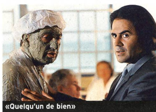
«Quelqu'un de bien»

Avec Stephen Chow, Vicki Zhao Wei, Ng Mang-Tat... (2001, Chine - Filmcooperative). Durée 1 h 28. En salles le 9 octobre.