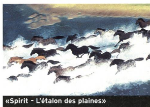
«Spirit - L'étalon des plaines»