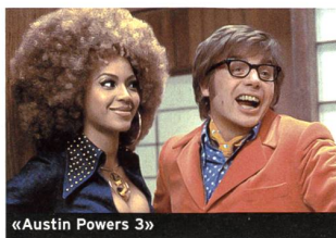
«Austin Powers 3»