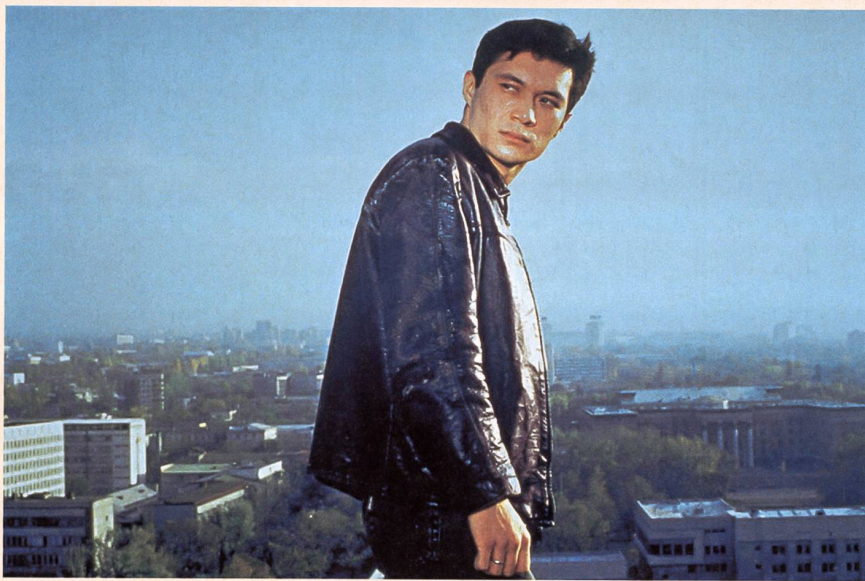
«Marat, tueur à gages» («Killer») de Darejan Ormibaev

péenne. L'exercice est encore plus révélateur avec «Le singe» («Maimal», 2001) d'Aktan Abdykalikov à découvrir en première suisse, mais flanqué du «Fils adoptif» («Beshkempir», 1998). La comparaison est édifiante: en narrant les infortunes d'un jeune villageois surnommé le singe en raison de ses oreilles décollées, Abdykalikov poursuit certes la chronique de sa communauté, mais son deuxième long