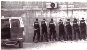
«Chronique d'une disparition»