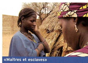
«Maîtres et esclaves»