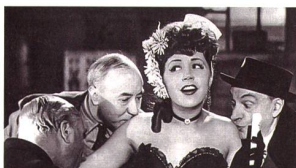
«Quai des Orfèvres»

«Quai des Orfèvres» (1947). Avec Suzy Delair, Louis Jovet, Bertrand Blier... Arte, 21 octobre, 20 h 45.