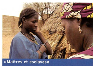
«Maîtres et esclaves»