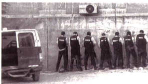
«Chronique d'une disparition»