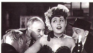
«Quai des Orfèvres»

«Quai des Orfèvres» (1947). Avec Suzy Delair, Louis Jovet, Bertrand Blier... Arte, 21 octobre, 20 h 45.