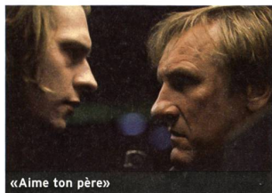
«Aime ton père»