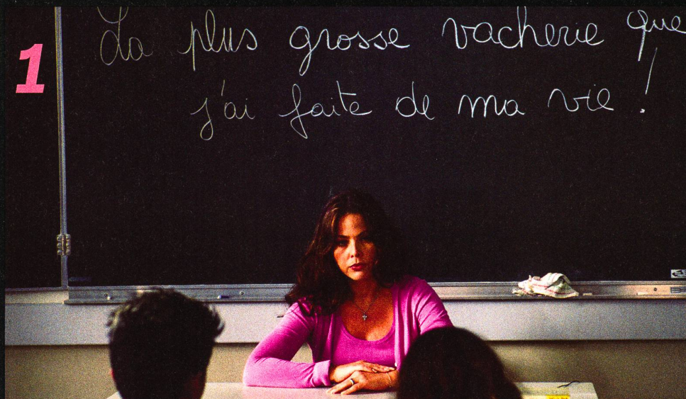
Une comédie: «Un couple épatant»