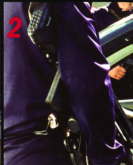
Un thriller: «Cavale»