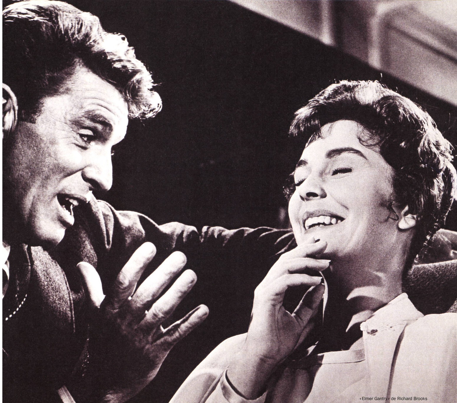
« Elmer Gantry » de Richard Brooks

Roof») et «Doux oiseau de jeunesse» («Sweet Bird of Youth»), leurs limites résident dans un manque d'affinités patent avec l'univers décadent de cet auteur.