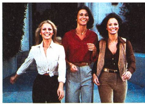
La série originale de 1976

Genre « spécifiquement télévisuel », la série a toujours entretenu des rapports étroits avec le cinéma. Echanges de bons procédés entre le grand et le petit écran. Par Mathieu Loewer